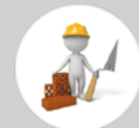
Departamento de reformas