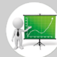
Departamento de marketing y ventas