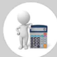
Departamento fiscal y contable